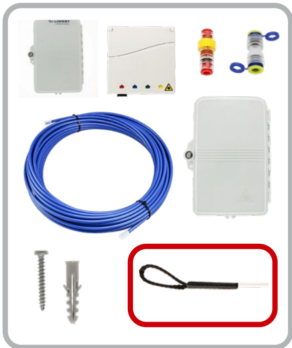
Version A, mit Einziehschleufe