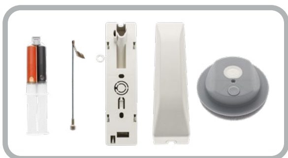
Inkl. Mauerdurchführungsset bei beiden Versionen